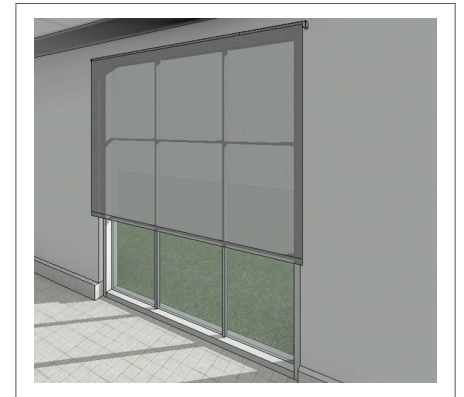
Objeto BIM Multinivel